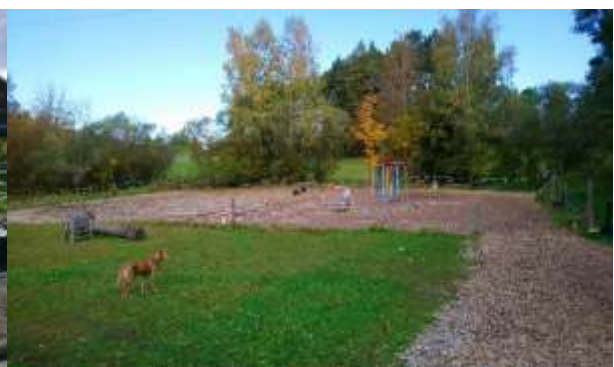
Abbildung 6: Blick in Richtung Norden auf den westlichen Reitplatz

Laut Stellungnahme der Unteren Naturschutzbehörde (Sept. 2018) handelt es sich bei den amtlich kartierten Biotopen um „Streuwiesen sowie unverbaute Gewässer mit Ufervegetation“. Vor allem die naturnahe Ufervegetation mit Hochstauden und Ufergehölzen ist an der nordwestlichen Ecke des Plangebiets durch die Anlage des Reitplatzes bereits vorbelastet. Die Hochstaudenflur entlang des nördlich verlaufenden Grabens setzt sich hauptsächlich aus Springkraut und stellenweise