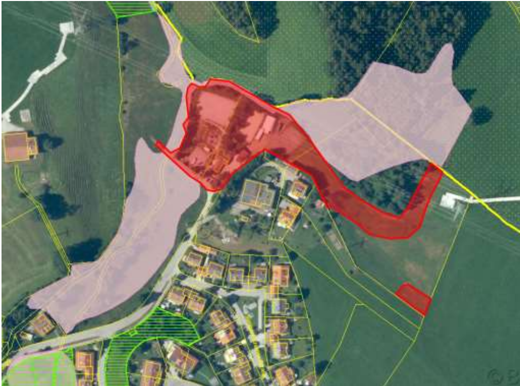
Abbildung 4: Lage der angrenzenden amtlich kartierten Biotopflächen (rosa) und Flächen des Ökoflächenkatasters (grün schraffiert), Quelle: Bayern Atlas, unmaßstäblich

Der westliche Gartenbereich besteht aus einer mehrschürigen Mähwiese und wird teilweise als Spielplatz genutzt. Nördlich davon befindet sich ein offener Reitplatz. Im Zentrum des Plangebiets steht ein befestigter Stall mit Aufenthaltsraum, mehrere temporär aufgestellte Stallzelte, ein weiterer offener Reitplatz, ein Paddock und mehrere Kleinanlagen (Heulager, Offenstall, Mistplatz, Stellplätze). Der Planbereich wird randlich und zentral bei den Gebäuden durch Gehölze gegliedert (vgl. Abb. 2).