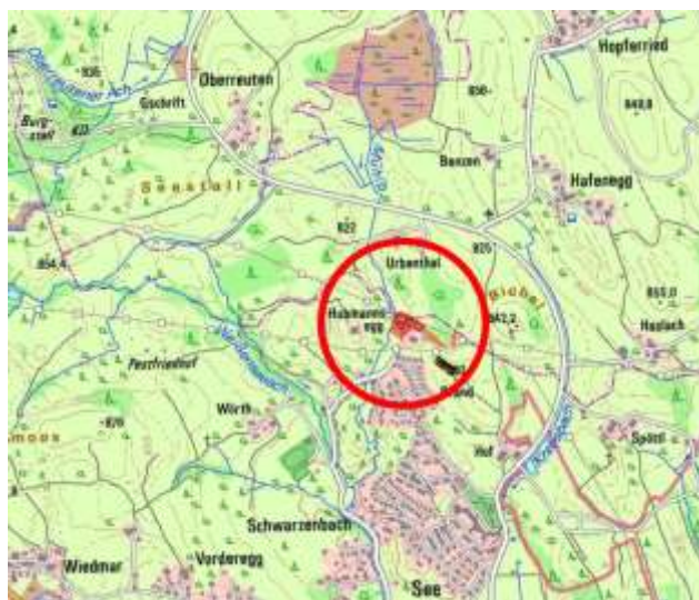
Abbildung 2: Lage des Plangebiets „Brand-Mühlbach“ im Untersuchungsraum

Das Plangebiet liegt innerhalb der naturräumlichen Haupteinheit „Voralpines Moor- und Hügelland“ (D-66) am nördlichen Rand der Ortschaft Brand, Stadt Füssen, im Landkreis Ostallgäu, Regierungsbezirk Schwaben. Im Umfeld des Geltungsbereichs verlaufen keine größeren Straßen, die Pfrontener Straße als Verbindung zwischen Füssen und Pfronten befindet sich etwa 1 km südlich.