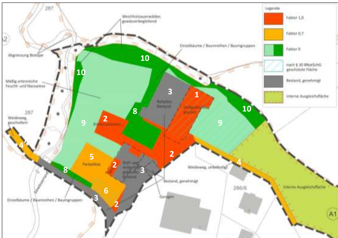
Abbildung 8: Übersicht über die bilanzierten Flächen, unmaßstäblich (weiße Nummerierung bezieht sich auf Tab. 2)

Die Bilanzierung und Berechnung der überbauten (inkl. der bereits bestehenden, jedoch noch nicht genehmigten) Flächenergibt einen Ausgleichsbedarf von 15.097 WP (vgl. nachfolgende Tabelle). Bei Realisierung der geplanten Ausgleichsmaßnahmen auf der Ausgleichsfläche A1 können 13.900 WP , auf der Ausgleichsfläche A2 1.200 WP generiert werden. Damit ist der Ausgleichsbedarf vollständig erbracht.