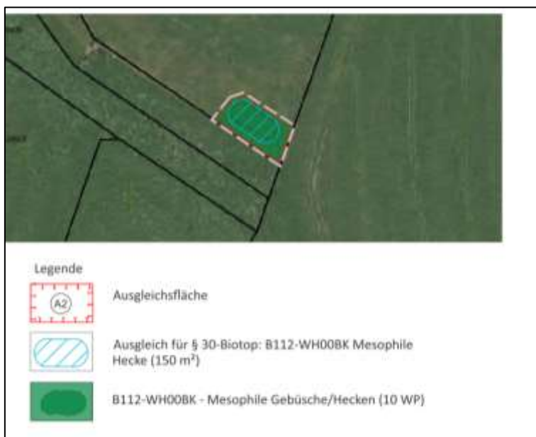
Abbildung 10: Ausgleichsfläche A2 südlich der Fläche A1