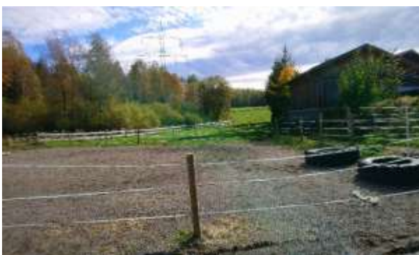
Abbildung 5: Blick in Richtung Osten, rechts die Bebauung des Nachbargrundstücks

Der westliche Gartenbereich besteht aus einer mehrschürigen Mähwiese und wird teilweise als Spielplatz genutzt. Nördlich davon befindet sich ein offener Reitplatz. Im Zentrum des Plangebiets steht ein befestigter Stall mit Aufenthaltsraum, mehrere temporär aufgestellte Stallzelte, ein weiterer offener Reitplatz, ein Paddock und mehrere Kleinanlagen (Heulager, Offenstall, Mistplatz, Stellplätze). Der Planbereich wird randlich und zentral bei den Gebäuden durch Gehölze gegliedert (vgl. Abb. 2).