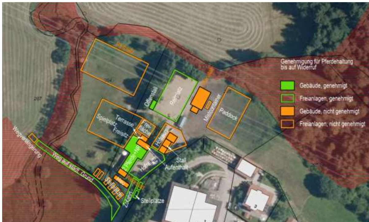
Abbildung 1: Übersicht über die genehmigten und die nicht genehmigten baulichen Anlagen