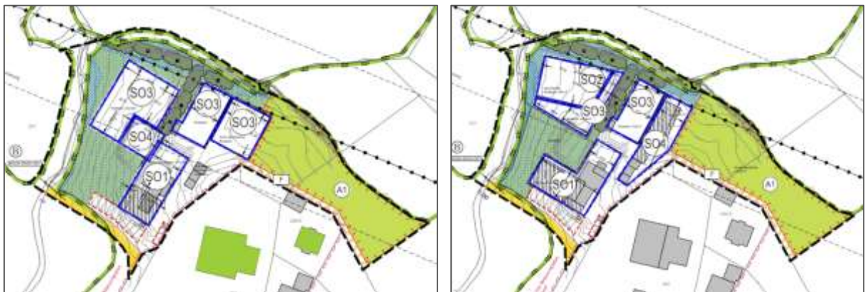
Abbildung 11: Beispiele für im Laufe des Planungsprozesses untersuchte und verworfene Varianten

Aufgrund der schon vorhandenen Gebäude und der festgelegten Zufahrt besteht im Planbereich wenig Spielraum für grundsätzlich andere Planungsalternativen. Im Zuge der Erarbeitung des vorliegenden Bebauungsplans wurden verschiedene Situierungen der Gebäude und Anlagen untersucht.