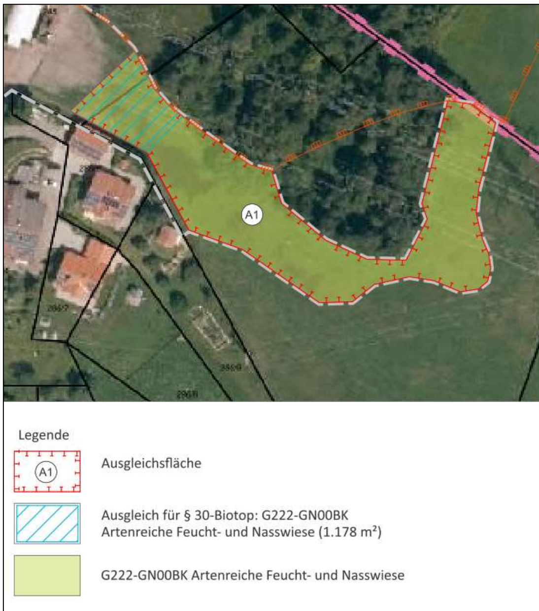
Abbildung 9: Luftbild der Ausgleichsfläche A1, unmaßstäblich (orange: amtl. Biotopkartierung)

Die Fläche ist an ihrer West-, Süd- und Ostseite abzuzäunen, um zu verhindern, dass Pferde oder Ponys auf die Fläche gelangen können. Eine Beweidung ist ausgeschlossen. Die Pflege erfolgt durch ein- bis zweimalige Mahd ab Anfang Juli (erste Mahd) bzw. September / Oktober (zweite Mahd) mit völliger Bewirtschaftungsruhe bis zur ersten Mahd. Zur Aushagerung kann je nach Aufwuchsmenge (nach Rücksprache mit der Unteren Naturschutzbehörde) in den ersten drei Jahren auch eine dreimalige Mahd pro Jahr (erster Schnitt ab Anfang Juni) durchgeführt werden. Je nach Artaufkommen ist langfristig eine einmalige Mahd mit dem 1.8. als Schnittzeitpunkt sinnvoll. Dies ist gegebenenfalls nach der Aushagerung in Abstimmung mit der UNB zu überprüfen. Zur Sicherstellung der Extensivierung der Fläche ist vollständig auf jeglichen Dünger- und Pflanzenschutzmitteleinsatz zu verzichten. Das Mahdgut muss abtransportiert werden.