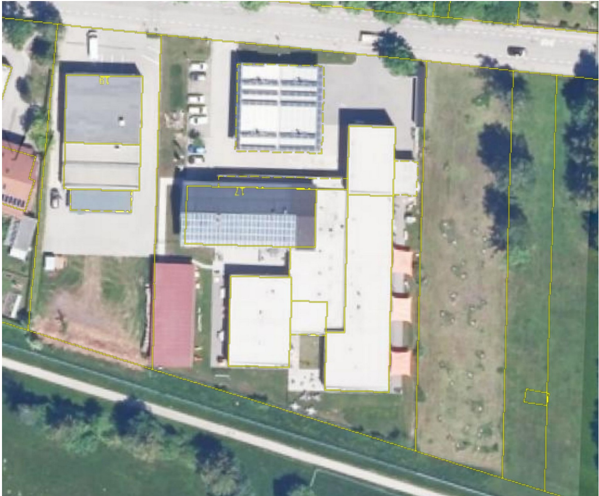
Abbildung 3: Luftbild des Planbereiches (Bayerische Vermessungsverwaltung, 2022), unmaßstäblich

Die bestehenden Gebäude weisen Flach- oder Satteldächer auf, die zu guten Teilen mit Solarpaneelen belegt sind. Parkplätze und Bewegungsflächen sind im Norden an der Hiebelerstraße orientiert. Die Freiflächnutzung findet vorwiegend in südliche Richtungen statt.