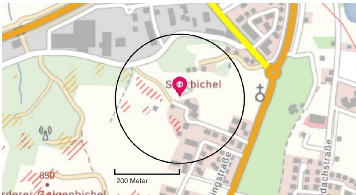
Abbildung 1: Ausschnitt mit Darstellung der abbruchgefährdeten Bereiche, LfU ( www.lfu.bayern.de ), mit Maßstab

Auswirkungen: Die Versiegelung von Oberflächen, die Überbauung und die Befahrung der Wege verändern die Oberbodenstruktur. Tiefere Bodeneingriffe müssen nur in begrenzten, vorgeprägten Bereichen vorgenommen werden. Die touristische Nutzung wird zwar intensiviert, aber auf den Boden keine direkte verstärkt negative Wirkung entfalten. Geeignete Maßnahmen können die Auswirkungen durch die baulichen Maßnahmen reduzieren (z.B. verminderte Flächenversiegelung, Erosionsschutz, Wasserrückhaltung, s.u.). Der Versiegelungsgrad wird möglichst gering gehalten. Die Flächen werden nach der Planung um ca. 10 % verstärkt in Anspruch genommen, bleiben aber im gebietstypischen Rahmen. Die Hangbereiche mit Hartgrund werden nicht beeinträchtigt. Ergebnis: Versiegelung und Baumaßnahmen führen zu Umweltauswirkungen geringer Erheblichkeit der nur regional bedeutsamen Böden.