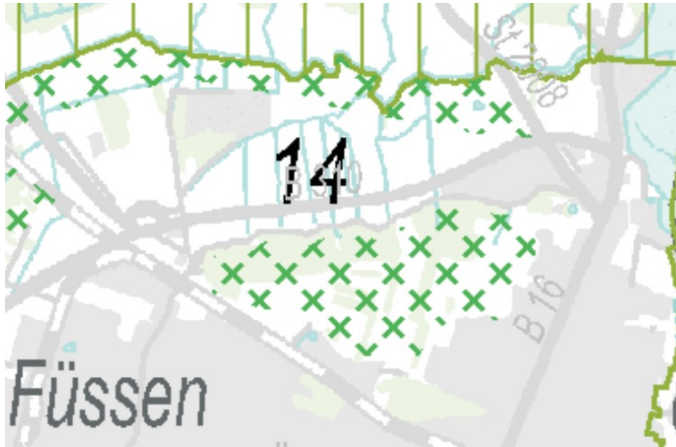
Abbildung 3: Ausschnitt aus Karte 3 - Natur und Landschaft des RP 16