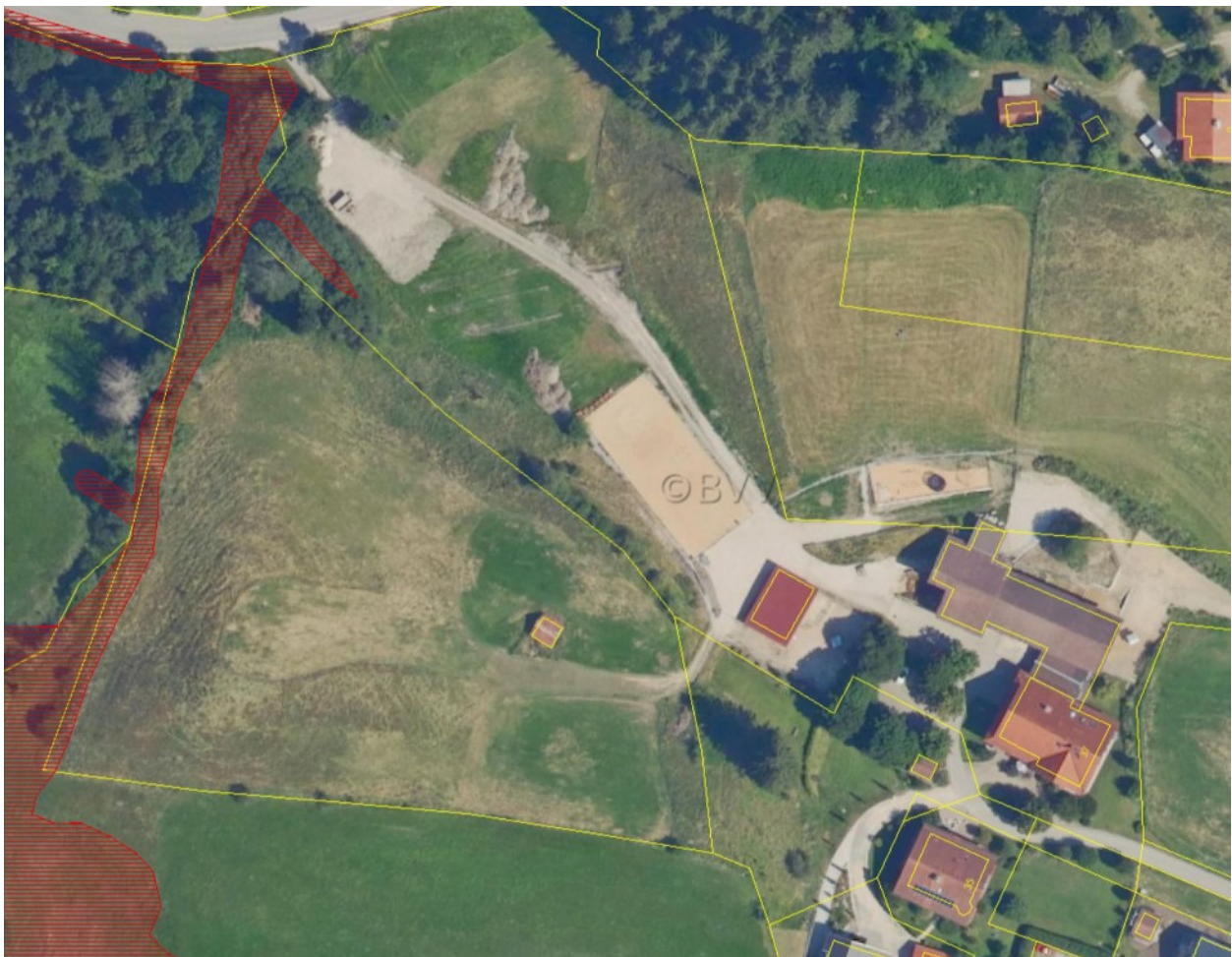
Abbildung 3: Luftbild mit Parzellierung (gelb) und Flachlandkartierung (rot), LfU (Juli `22, www.lfu.bayern.de ), unmaßstäblich

Biosphärenreservate, FFH- oder Vogelschutzgebiete sind von der Planung nicht betroffen.