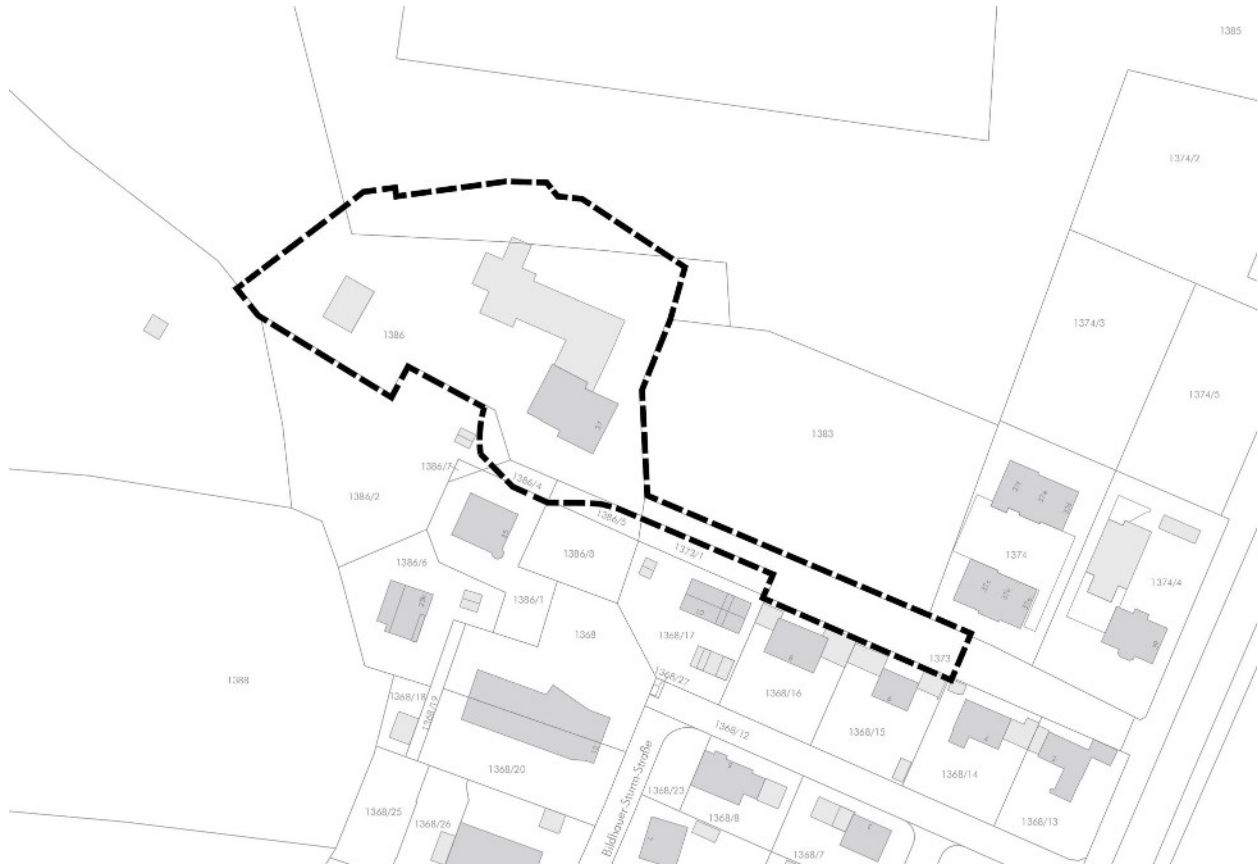
Abbildung 1: Lageplan des Geltungsbereiches, unmaßstäblich

Das Plangebiet weist eine Größe von ca. 0,74 ha auf. Maßgeblich ist die Bebauungsplanzeichnung.