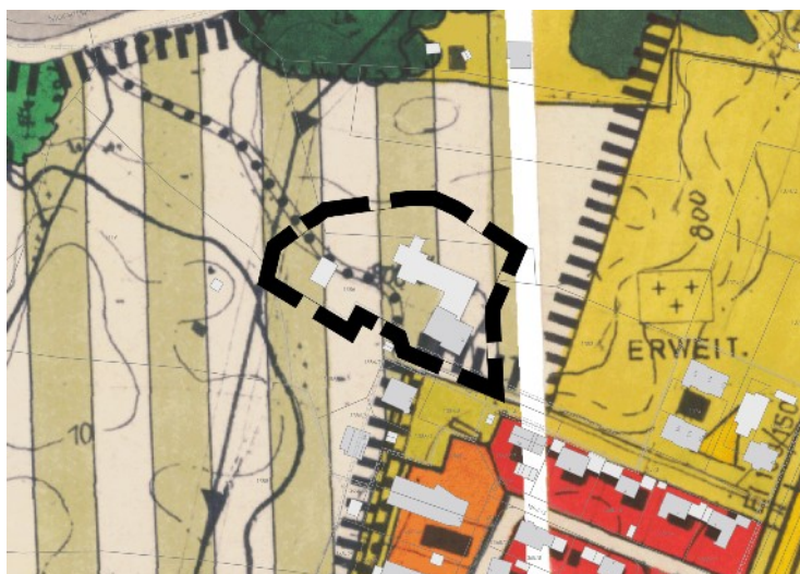
Abbildung 2: Auszug aus dem FNP der Stadt Füssen mit Lage des Sondergebietes für den Ferienhof

Die Stadt Füssen verfügt über einen wirksamen Flächennutzungsplan, ursprünglich aufgestellt von der Ortsplanungsstelle für Schwaben, Augsburg, und dem Landschaftsarchitekten W. Blendermann, Eurasburg (Fertigung vom Dez. 1987). Die Flächendarstellungen sehen im Bereich einen schützenswerten Landschaftsteil (Balkenlinie) und Flächen für die Landwirtschaft mit besonderer ökologischer und orts- und landschaftsbildlicher Bedeutung sowie eine Stromleitung vor. Der noch als Grünfläche dargestellte Nordrand der Wohn- und Sonderbaufläche ist inzwischen bebaut. Eine Friedhofserweiterung ist bisher nicht erfolgt. Die Wegeverbindung ist nicht Bestandteil der ausgewiesenen touristischen Wanderwege von Füssen. Diese liegen weiter südlich. Die damals schon bestehende Hofstelle mit Pferdestall im Talbereich hat Ende der 80er keine gesonderte Darstellung erfahren.