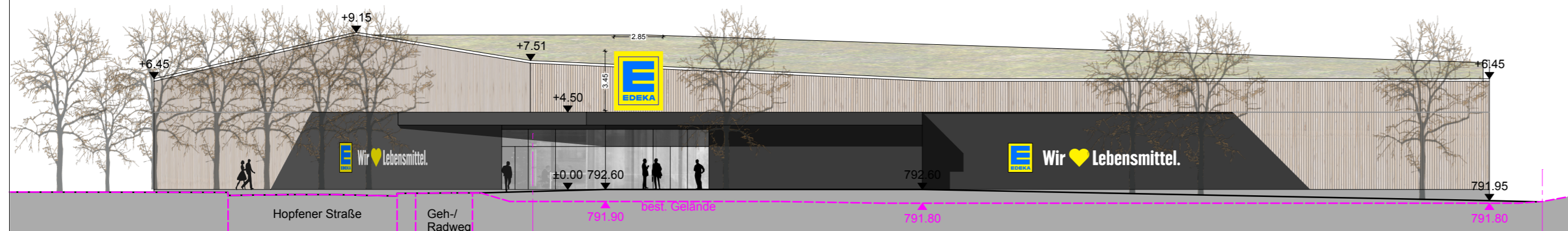
Ansicht Nord - Parkplatz