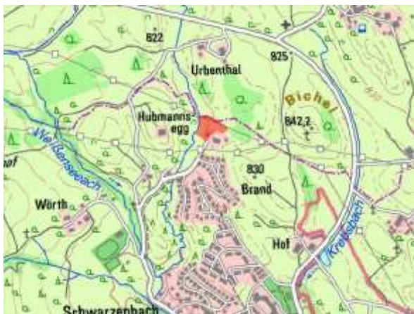
Abbildung 1: Lage des Plangebiets „Brand-Mühlbach“ im Untersuchungsraum

Der Geltungsbereich der Flächennutzungsplanänderung liegt im nördlichen Siedlungsgebiet von Brand. Der Geltungsbereich umfasst eine Fläche von rund 0,56 ha und liegt am nördlichen Ende des Brandwegs. Nördlich anschließend befindet sich die Grenze zwischen dem Gebiet der Gemeinde Füssen und der Verwaltungsgemeinschaft Seeg.