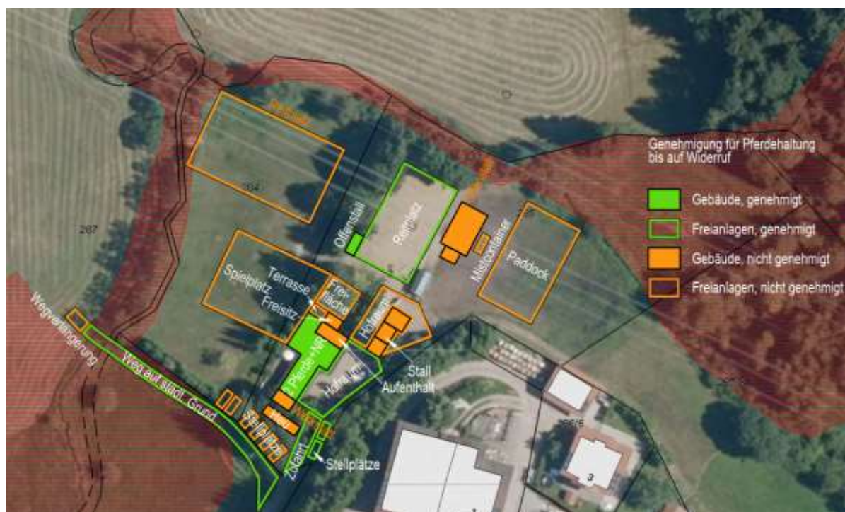
Abbildung 2: Übersicht über die genehmigten und die nicht genehmigten baulichen Anlagen

Das Plangebiet wird derzeit bereits als Reitanlage genutzt und umfasst bisher ein genehmigtes Gebäude mit Freianlagen (Stall mit Nebenräumen, Hofraum, Offenstall, Reitplatz) sowie zwei nicht genehmigte Gebäude und Freianlagen (nordöstlicher Stall, Offenstall, Paddock, Terrasse, Spielplatz, Reitplatz).