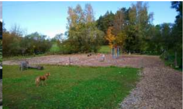
Abbildung 5: Blick in Richtung Norden auf den westlichen Reitplatz

Laut Stellungnahme der Unteren Naturschutzbehörde (Sept. 2018) handelt es sich bei den amtlich kartierten Biotopen um „Streuwiesen sowie unverbaute Gewässer mit Ufervegetation“. Vor allem die naturnahe Ufervegetation mit Hochstauden und Ufergehölzen ist an der nordwestlichen Ecke des Plangebiets durch die Anlage des Reitplatzes bereits vorbelastet. Die Hochstaudenflur entlang des nördlich verlaufenden Grabens setzt sich hauptsächlich aus Springkraut und stellenweise Brennnesseln zusammen. Im östlichen Bereich ist die dort vorhandene Streuwiese durch die vormalige Nutzung als Pferdekoppel in Teilen durch Trittschäden beeinträchtigt, die Beweidung wurde aber bereits aufgrund der Nässe der Fläche wieder eingestellt. Die westliche teilweise biotopkartierte Wiese weist zwar ebenfalls einige Trittschäden auf, insgesamt scheinen die Ponys aber die trockeneren Bereiche der Weide zu bevorzugen.