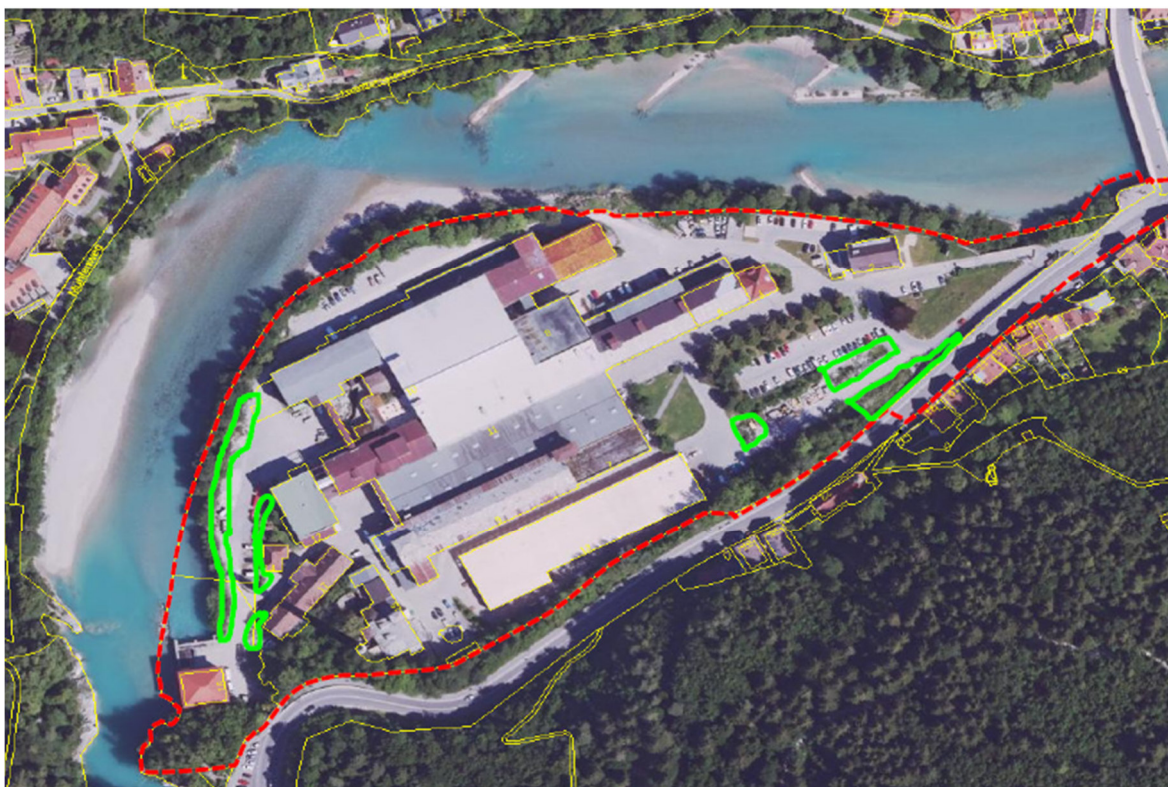
Abb. 6: Lage der potenziellen Reptilienhabitate (grün).

Schließlich gibt es an verschiedenen Stellen strukturreiche Böden, Böschungen oder steinig-felsige Strukturen mit nur lückiger Vegetation, die eine Eignung als Reptilienhabitate haben.