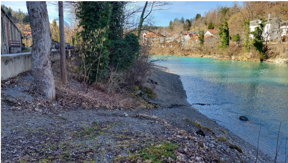
Abb. 10: Gehölze am Lechufer.