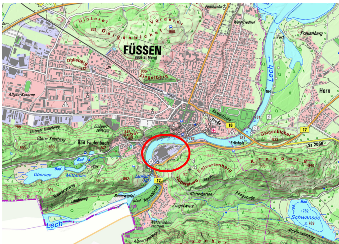
Abb. 1: Lage des Untersuchungsgebietes.

Ich wurde beauftragt, die artenschutzrechtlichen Belange zu prüfen. In einem ersten Schritt wurde die Relevanzprüfung durchgeführt, um zu sehen welche Betroffenheiten es gibt, und ob weitere Schritte der artenschutzrechtlichen Prüfung erforderlich sind. In der Relevanzprüfung wird ermittelt, ob ausgeschlossen werden kann, dass die artenschutzrechtlichen Verbotstatbestände nach § 44 Abs. 1 i.V.m. Abs. 5 BNatSchG bezüglich der gemeinschaftsrechtlich geschützten Arten (alle europäischen Vogelarten, Arten des Anhangs IV FFH-Richtlinie) durch das Vorhaben erfüllt werden.