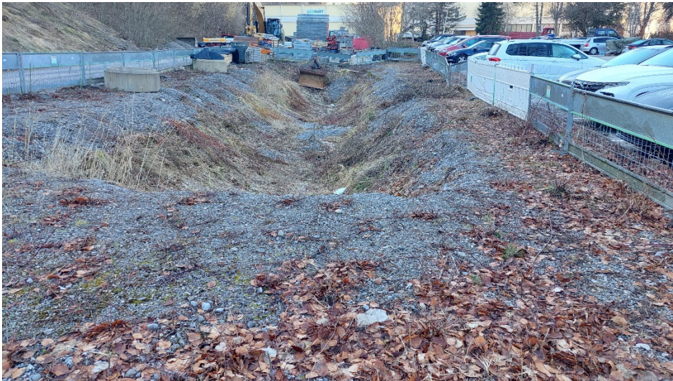
Abb. 13: Reste des vormaligen-Mühlenbachs.