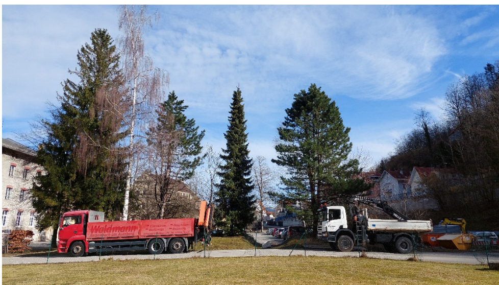
Abb. 9: Gehölze der derzeitigen Grünanlage des Plangebietes.