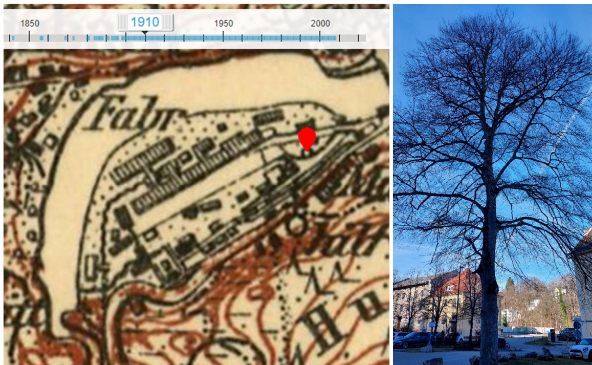
Abb. 5: Standort (Topographische Karte 1910) und Foto der großen, alten Buche.

Sehr markant ist eine große Rotbuche mit einem Stammdurchmesser von über 60 cm. Diese scheint bereits in die Topographische Karte von 1910 eingezeichnet zu sein und war anscheinend schon damals ein größerer Baum. Sie ist ein quartierbestimmendes Element und wohl ein Zeitzeuge des Industriestandortes im Lechgries aus den Anfängen der „Mechanischen Seilerwarenfabrik Füssen“ (gegründet 1861, der Mühlenstandort am „Lechkanal“ entstand ab 1789, 1836 gab es 33 Mühlräder auf dem Lechgries). Wie die denkmalgeschützten Gebäude sollte sie erhalten werden und Teil des historischen Ensembles werden. Während der Bauzeit ist gemäß Baumschutz-DIN 18920 für einen ausreichenden Schutz des Wurzelbereichs zu sorgen.