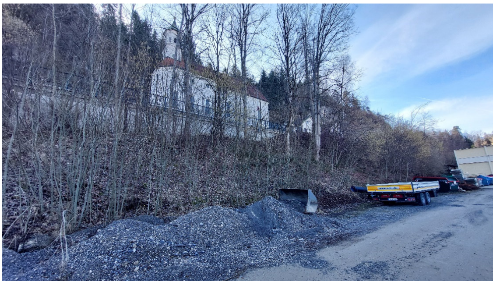
Abb. 7: Gehölze an der Böschung zur B17 hoch.