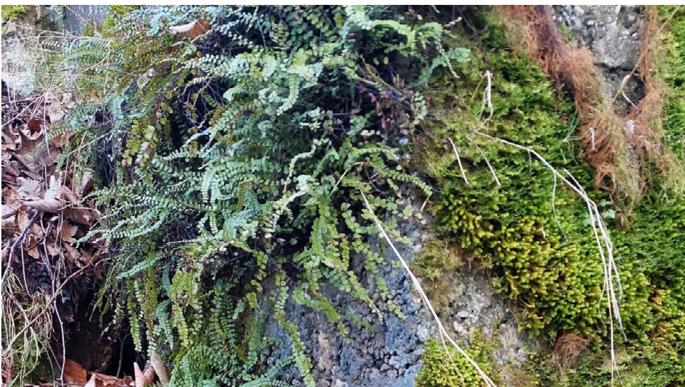
Abb. 12: Farne in Böschung zur B17 hoch auf „künstlichem“ Fels (Beton).