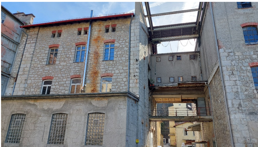
Abb. 16: Gebäude mit Vogelnestern und Quartier- potenzial für Fledermäuse.