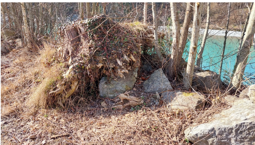
Abb. 15: Potenzielles Reptilienhabitat am Lech.