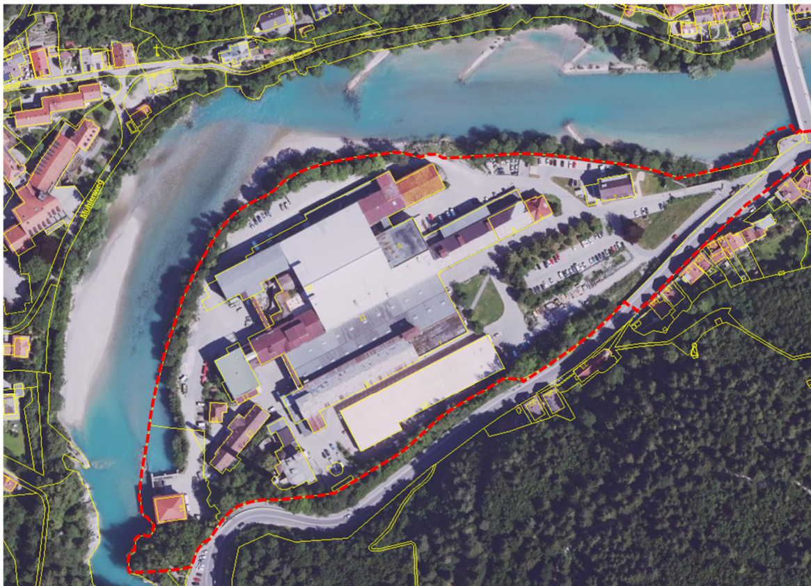
Abb. 2: Luftbild des Plangebietes (rot gestrichelt) und des Untersuchungsgebietes (durchgezogen).