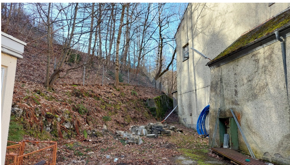
Abb. 8: Gehölze an der Böschung zur B17 hoch bei der ehemaligen Stadtmühle.