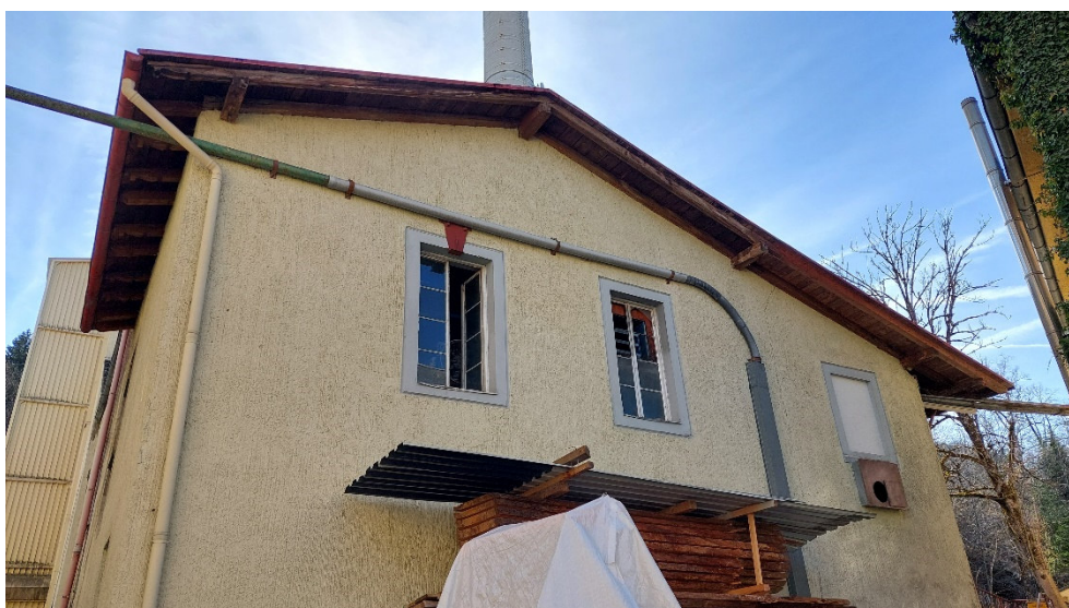
Abb. 17: Gebäude mit Quartierpoten- zial für Fleder- mäuse.