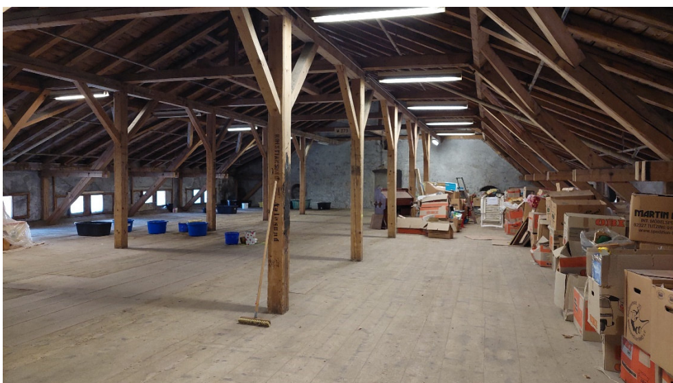
Abb. 18: Bei- spieldachstuhl, hier ohne Quar- tierpotenzial für Fledermäuse.