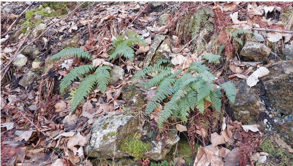
Abb. 11: Farne in biotopartiger Böschung zur B17 hoch (etwa Block-/Hang- schuttwälder, Felsvegetation).