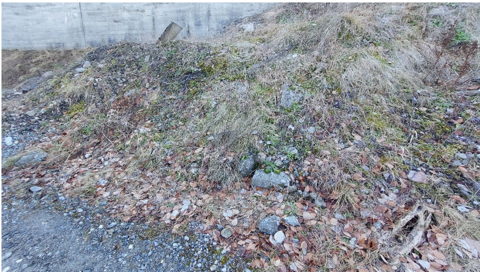
Abb. 14: Potenzielles Reptilienhabitat an der Böschung zur B17 hoch.