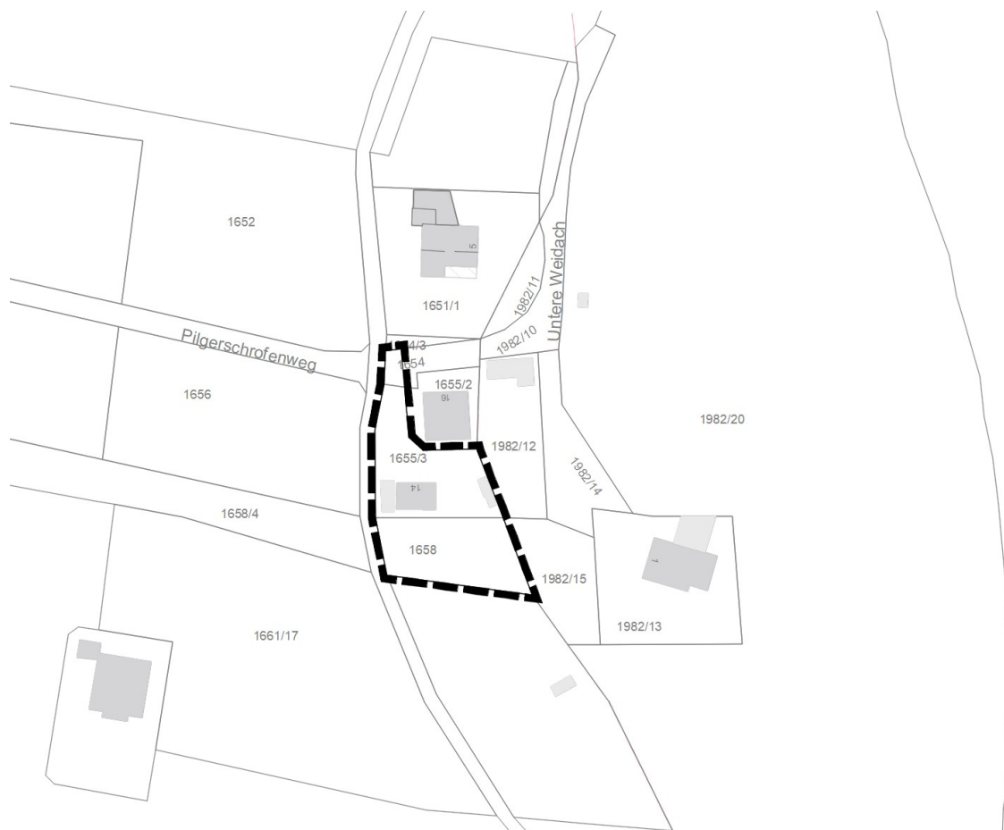
Abbildung 1: Lageplan der gegenständlichen Planung, unmaßstäblich

In der ursprünglichen Außenbereichssatzung Pilgerschrofenweg Ost und deren erster Änderung wurden die Baugrenzen im Plangebiet unmittelbar um den Bestand gezogen. Dies lässt für das Grundstück im Plangebiet der gegenständlichen zweiten Änderung allerdings nur eine bebaubare Grundfläche von ca. 50 m 2 zu. Auch war dort nur ein Vollgeschoss zulässig. Für eine familiengerechte Nutzung soll der Bestand nun durch einen etwas größeren Neubau mit Erdgeschoss und Dachgeschoss ersetzt werden. Auch sollen einige Gestaltungsfestsetzungen angepasst werden, um das Einfamilienhaus an dieser Stelle zu ermöglichen. Daher hat sich die Stadt Füssen dazu entschlossen, die gegenständliche zweite Änderung der Außenbereichssatzung Pilgerschrofenweg Ost aufzustellen.