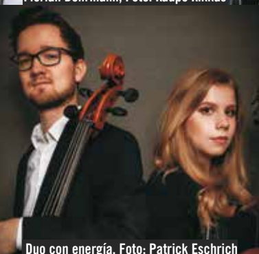
Duo con energía