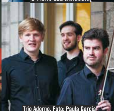
Trio Adorno

1951 – 2021 70 Jahre Kaisersaalkonzerte Füssen im Barockkloster St. Mang