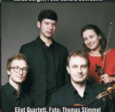
Eliot Quartett