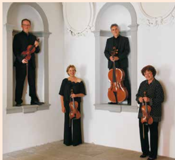
Verdi Quartett

Kartenvorverkauf ab 2. Mai 2019 bei der Tourist Information Füssen