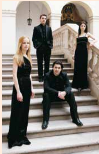
© Minetti Quartett, Foto: Oliver Jiszda

Seit seiner Nominierung für den „Rising Stars“ Zyklus der „European Concert Hall Organization“ 2008/09 konzertiert das Minetti Quartett wiederholt in den renommiertesten Konzertsälen in Wien, Berlin, Köln, Amsterdam, Barcelona, Stockholm, Brüssel, London etc.